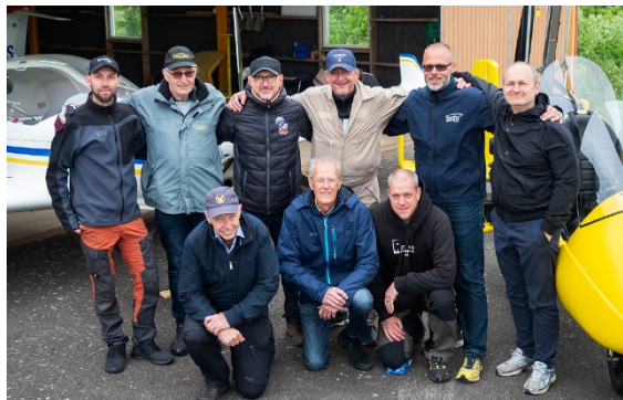
Nya UL-lärare 2019 (Övre raden) Kursens instruktörer (Nedre raden)